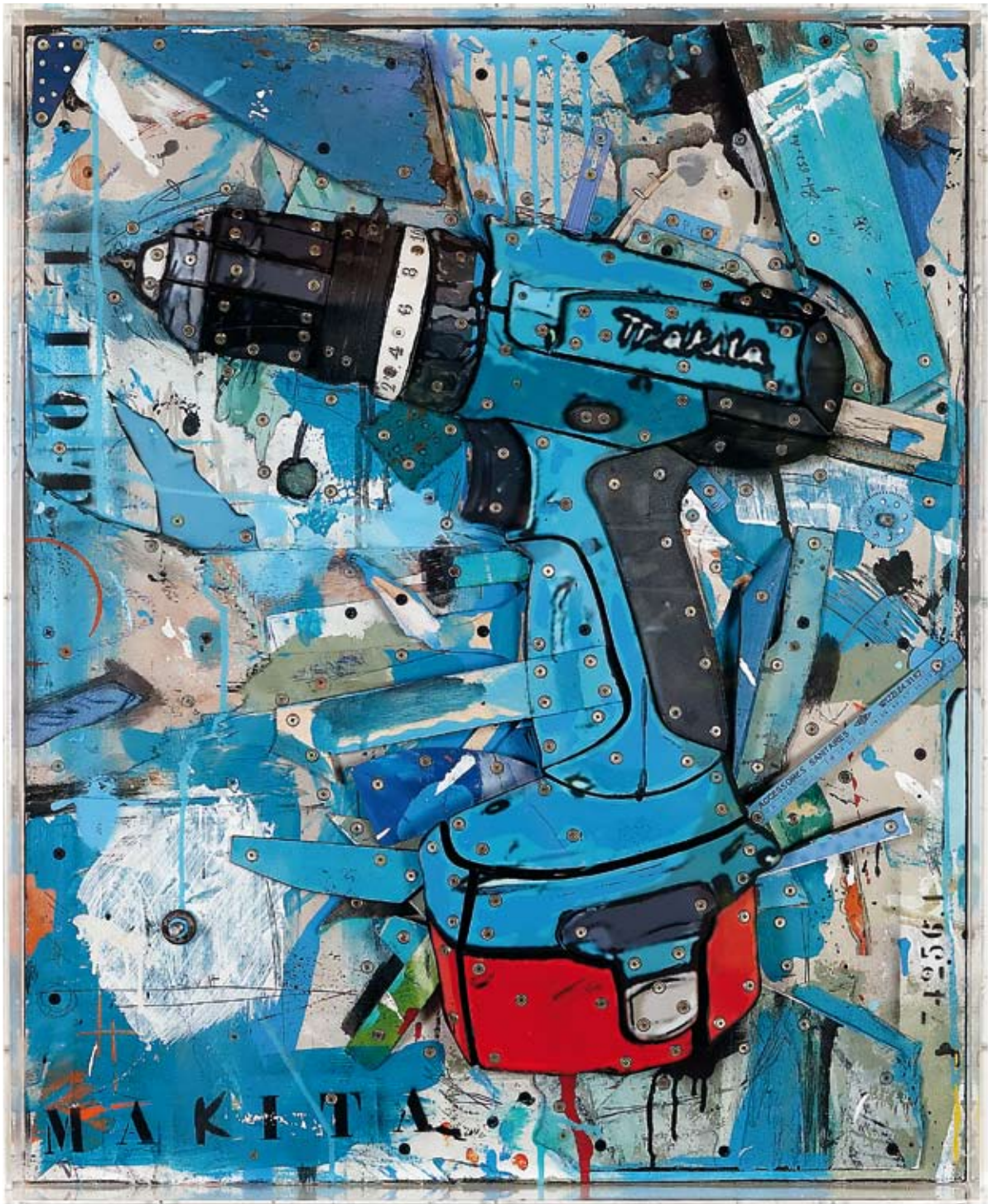
« Makita », assemblage de bois, collage acrylique, objets divers, 100 x 80, 2012