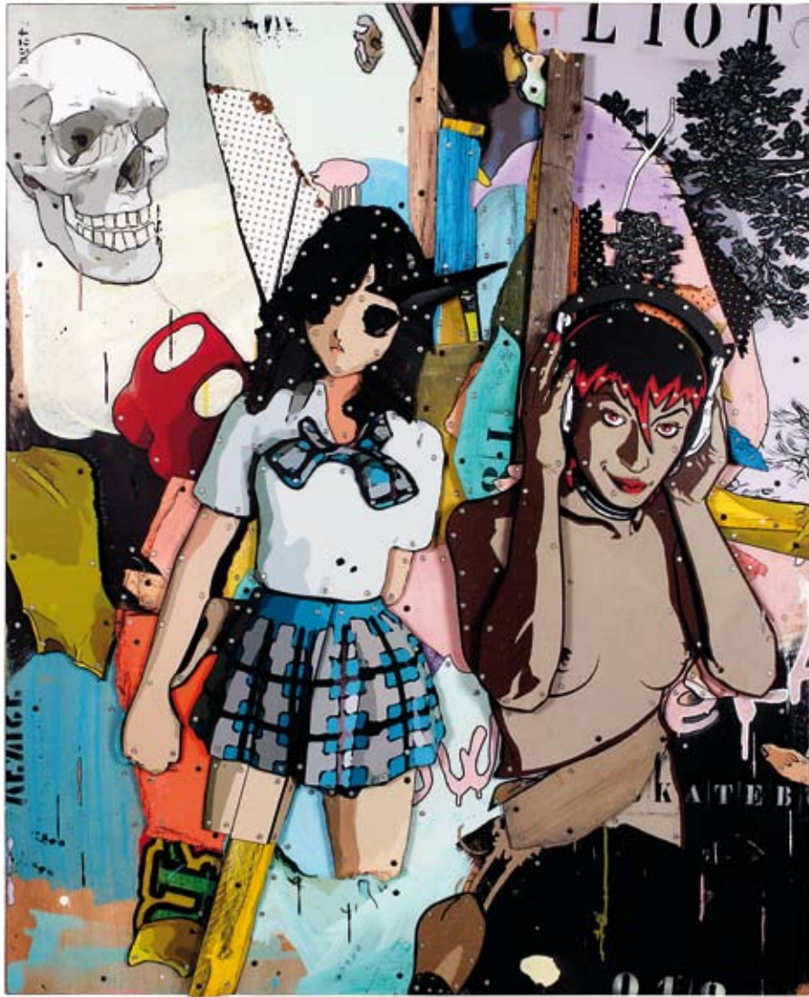
« Les filles de Powel et Peralta », assemblage de bois, collage acrylique, objets divers, 160 x 130, 2012