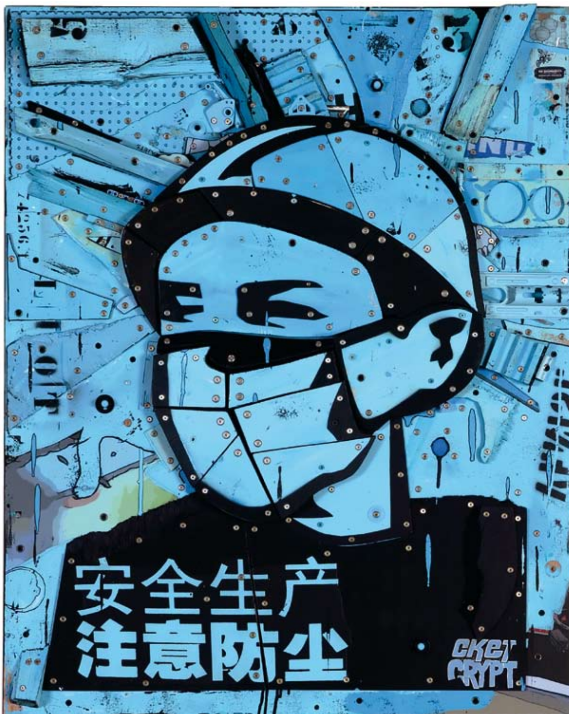
« Casque bleu », assemblage de bois, collage acrylique, objets divers, 100 x 80, 2012