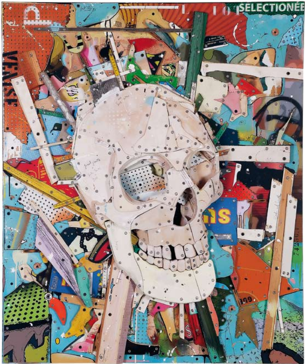
« Tête de mort », assemblage de bois, collage acrylique, objets divers, 120 x 100, 2012