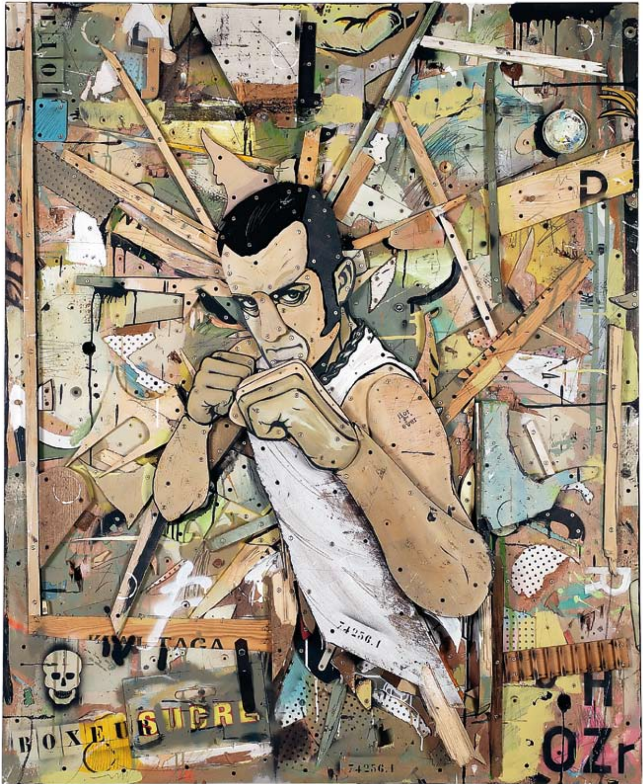
« Le boxeur », assemblage de bois, collage acrylique, objets divers, 160 x 130, 2012