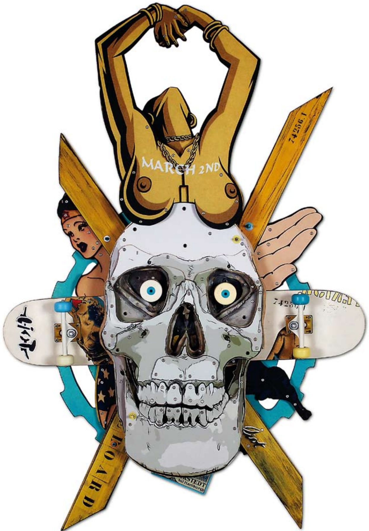
« Logo Liot skateboard », assemblage de bois, collage acrylique, objets divers, 160 x 100, 2012