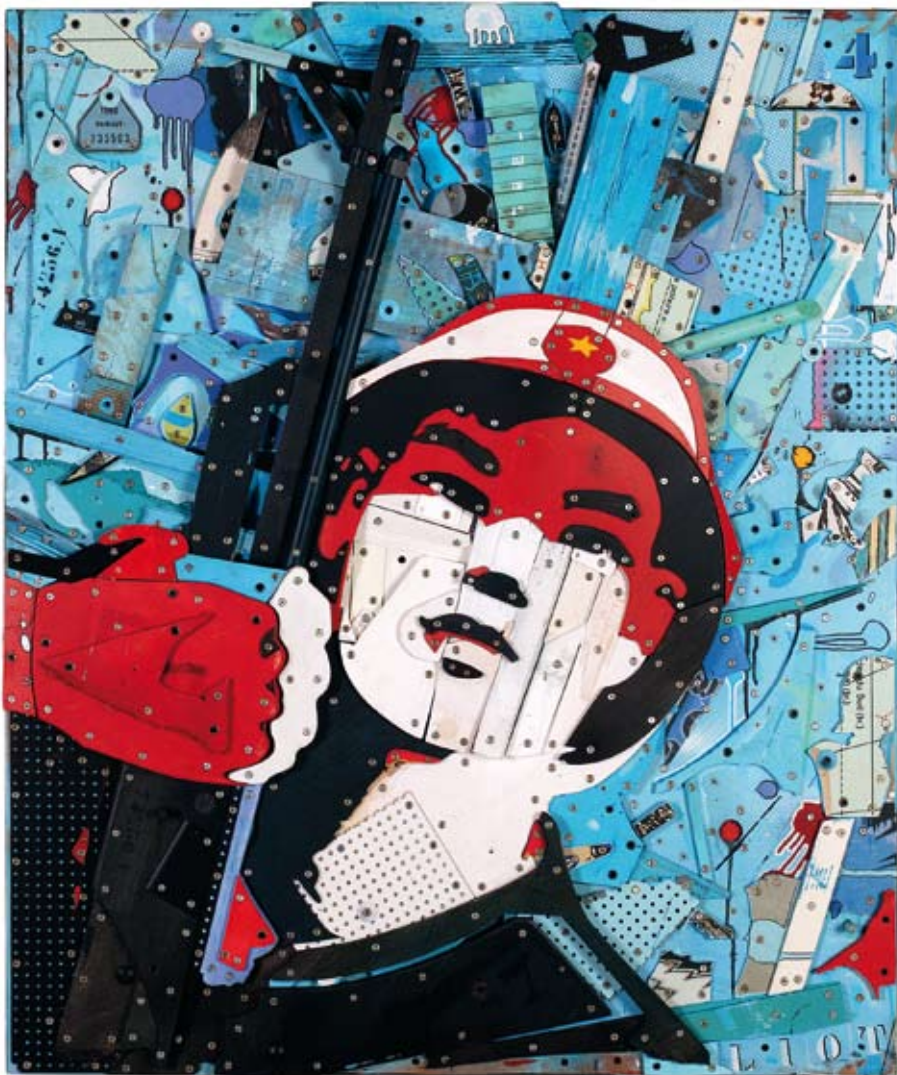
« Made in Vietnam », assemblage de bois, collage acrylique, objets divers, 120 x 100, 2012