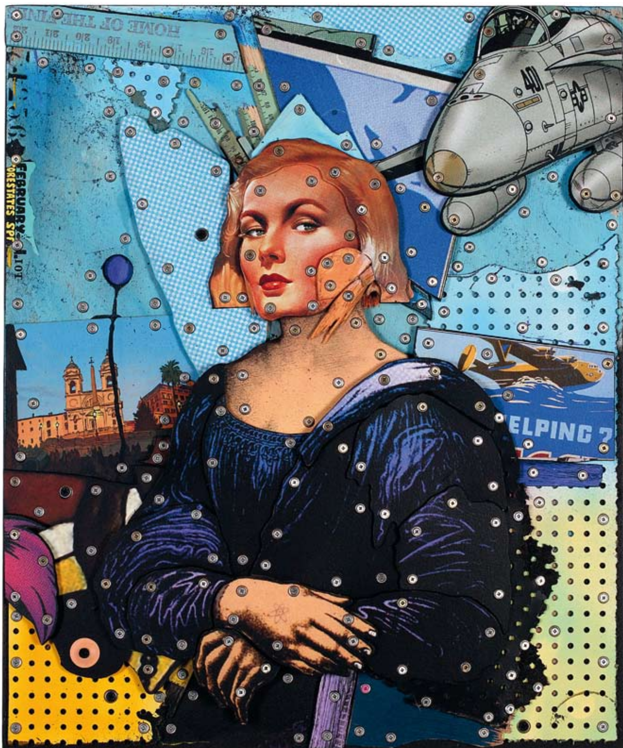
« Mona », assemblage de bois, collage acrylique, objets divers, 60 x 50, 2012