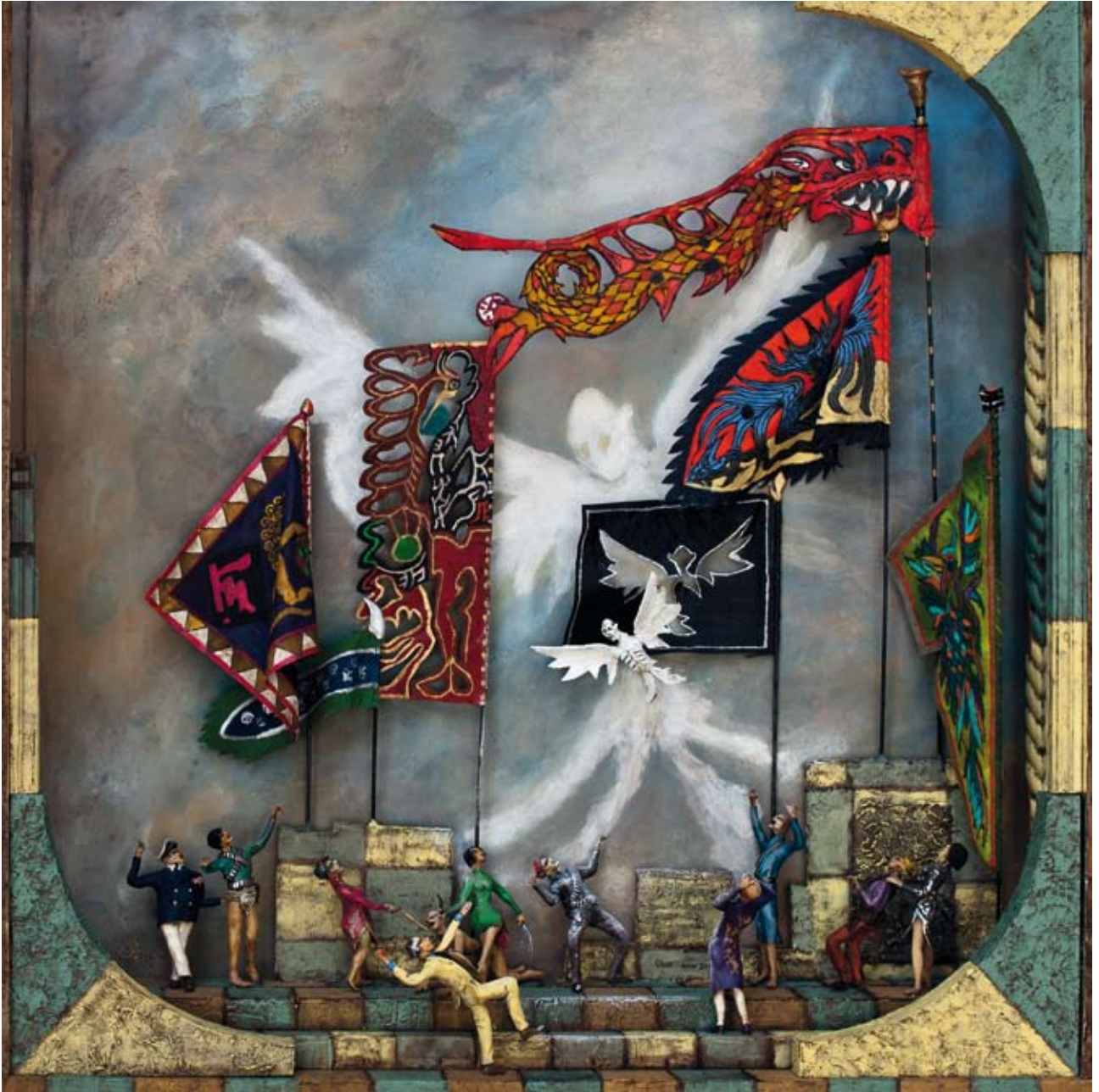
«Drapeaux vivants», boîte - technique mixte, 60 x 59 x 14, 2012