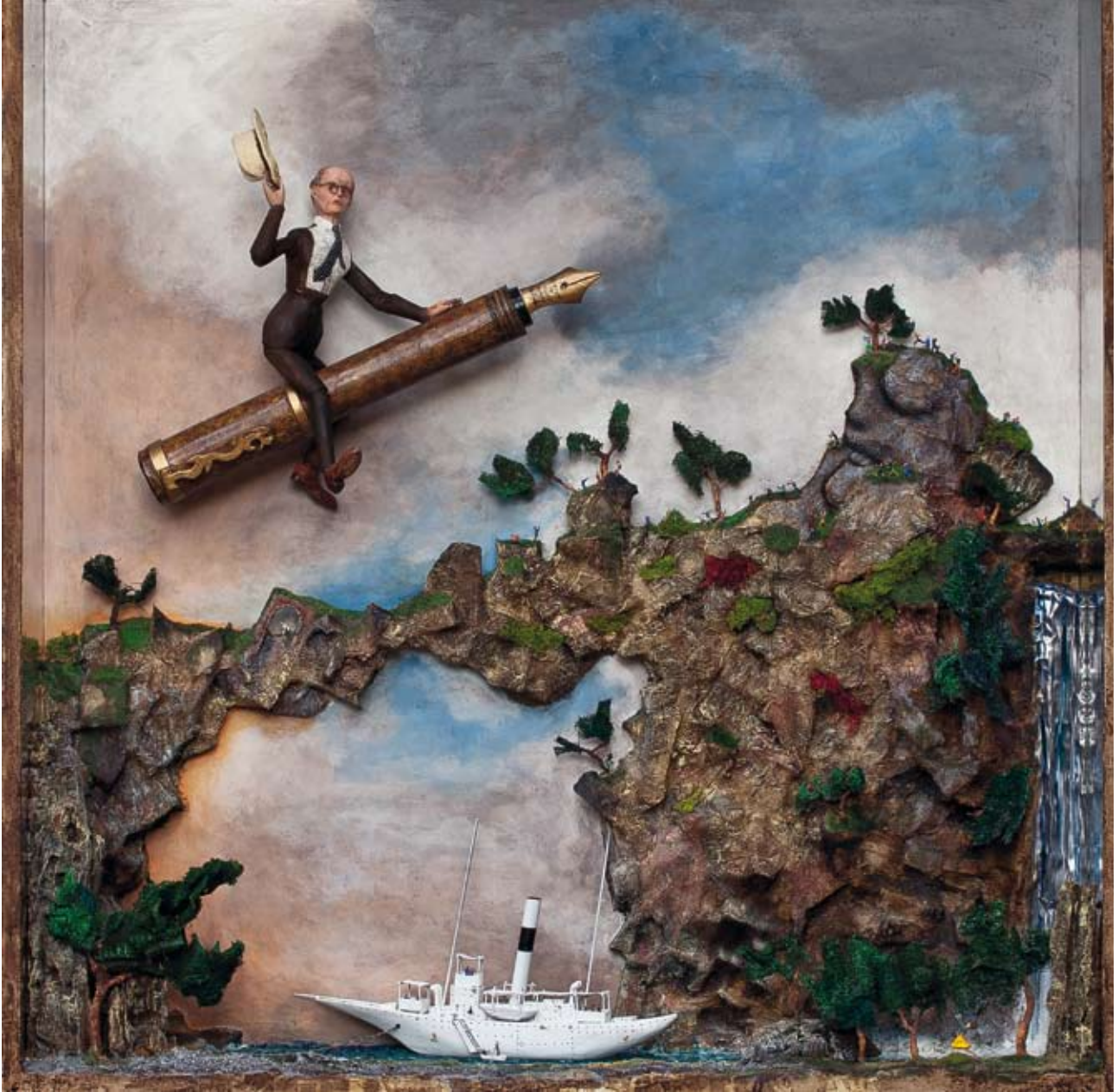
«Sérieusement ?», boîte - technique mixte, 100 x 100 x 21, 2015