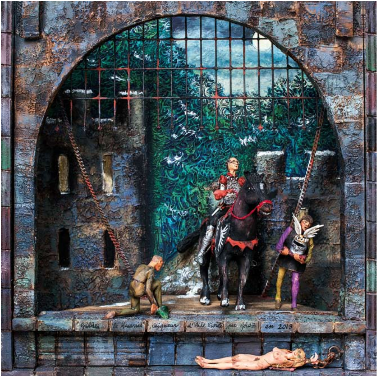
«Gilles le mauvais», boîte - technique mixte, 32 x 32 x 14, 2013