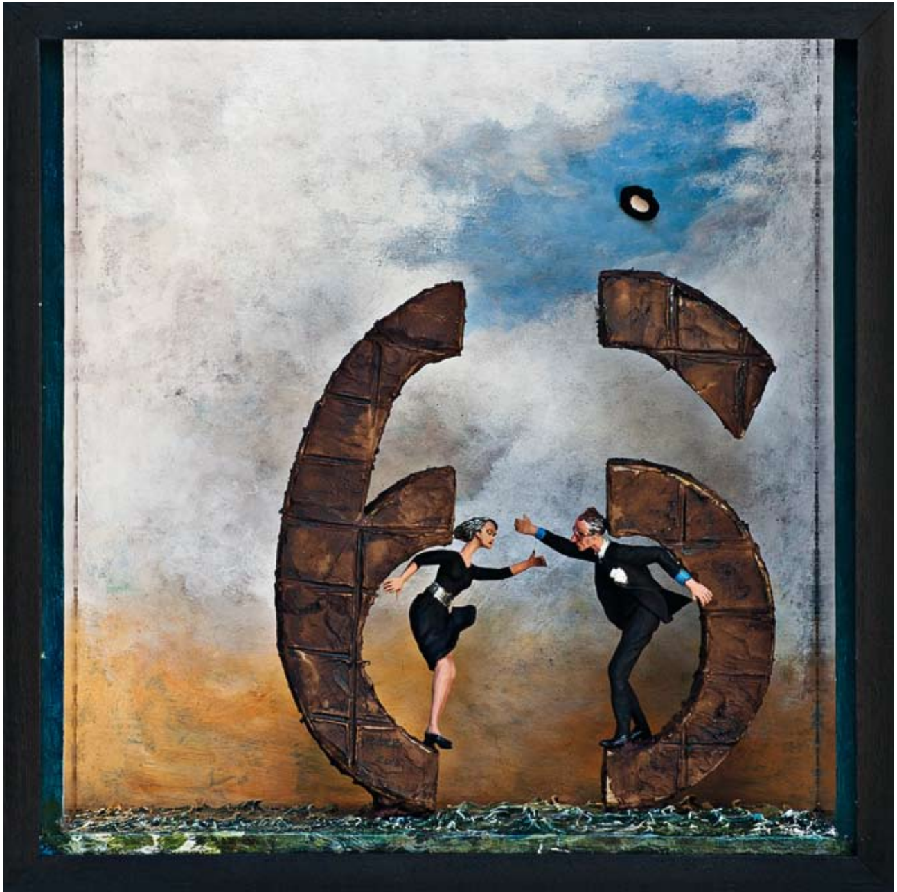
«Six scions», boîte - technique mixte, 32 x 32 x 14, 2015