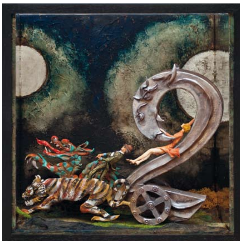
«Un visible», boîte - technique mixte, 32 x 32 x 14, 2014 «Le char à deux», boîte - technique mixte, 32 x 32 x 14, 2013