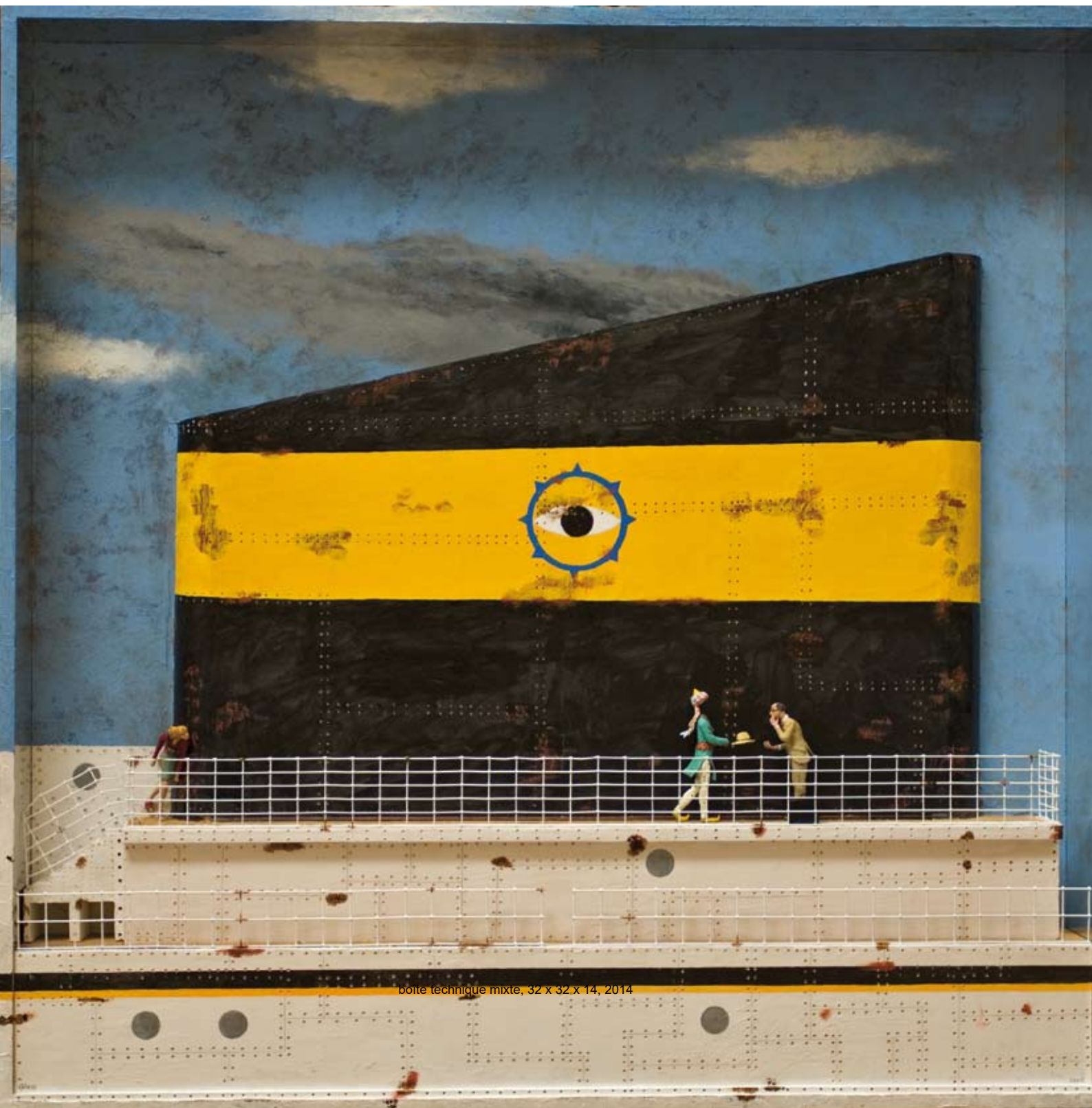
boîte technique mixte, 32 x 32 x 14, 2014