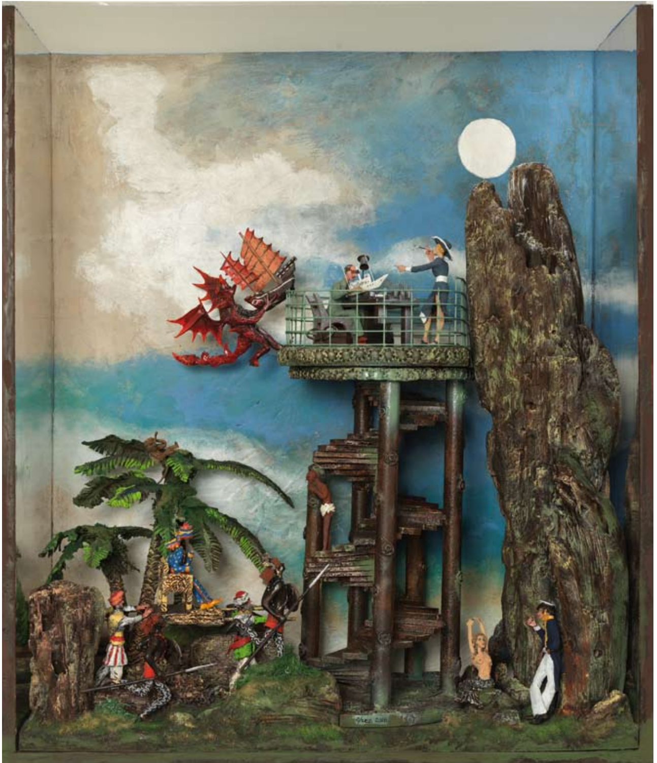
«Mon tour d'y voir», boîte - technique mixte, 70 x 60 x 25, 2016