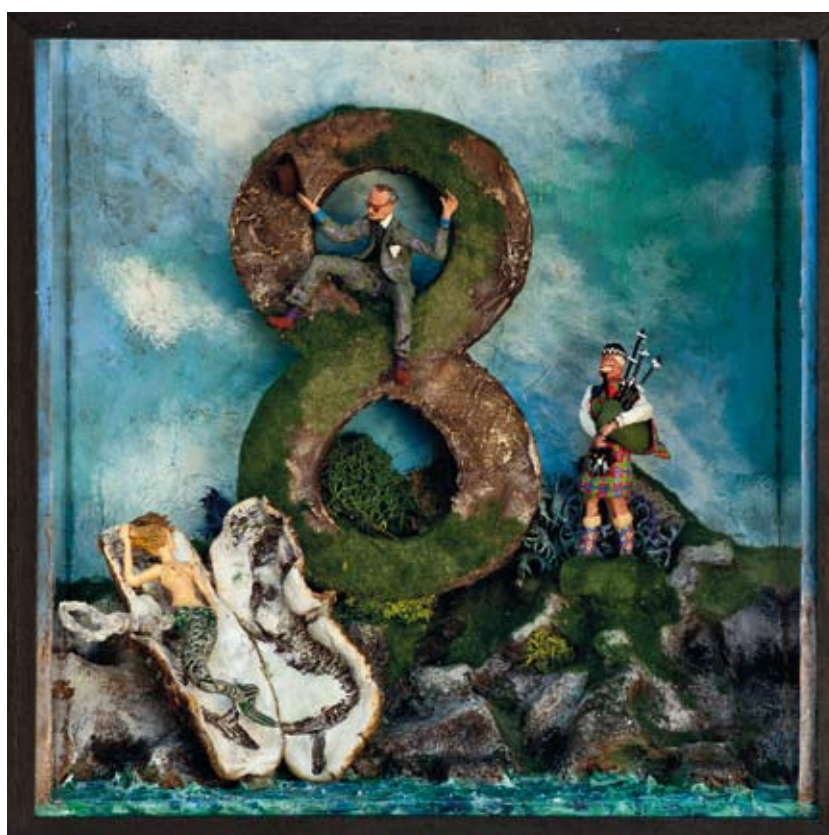
«Un cheval de Troie pour deux», boîte - technique mixte, 32 x 32 x 14, 2013 «Huit Récoissaise», boîte - technique mixte, 32 x 32 x 14, 2015