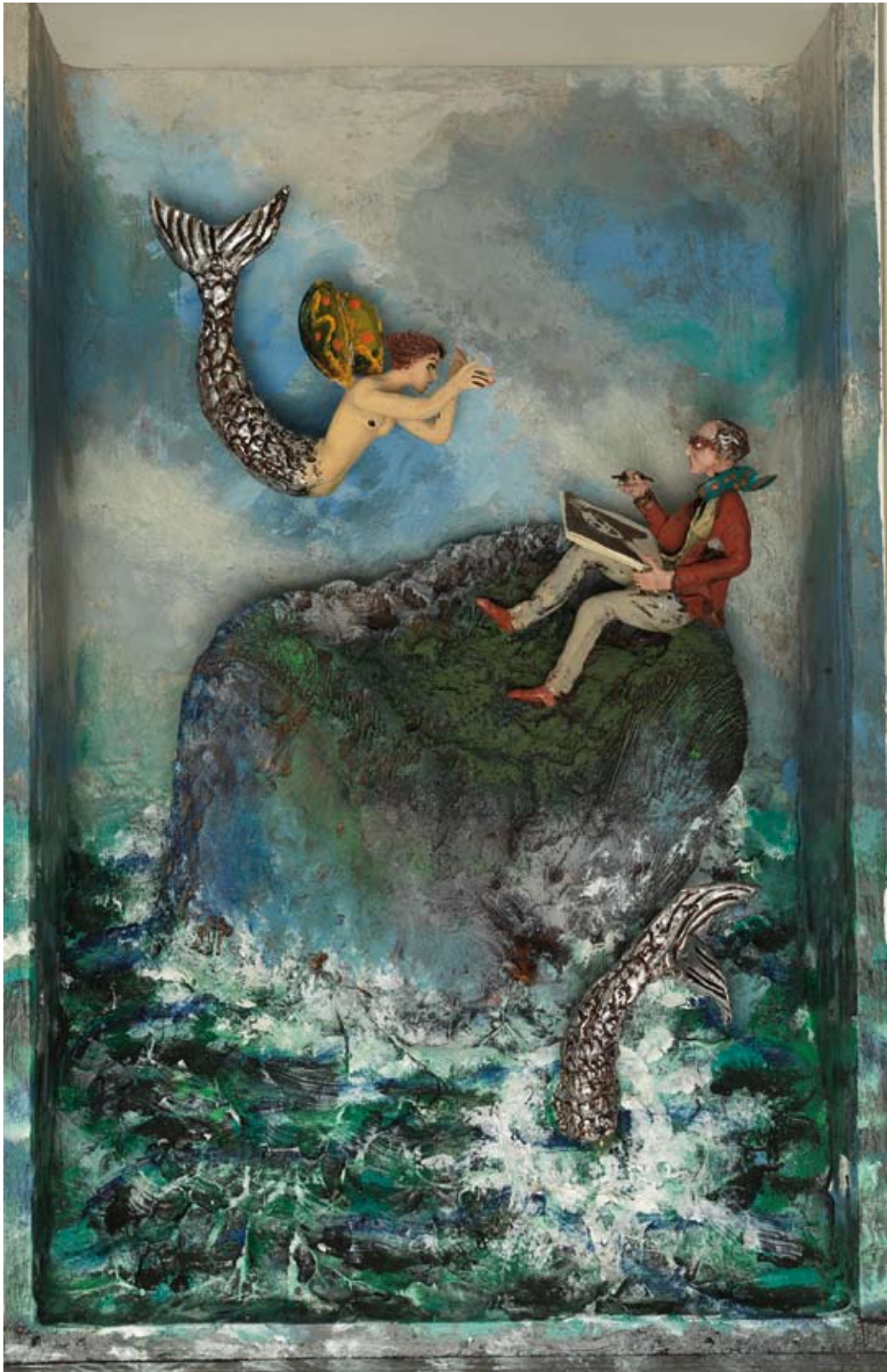
«Portrait volant», boîte - technique mixte, 35 x 22 x 8, 2016