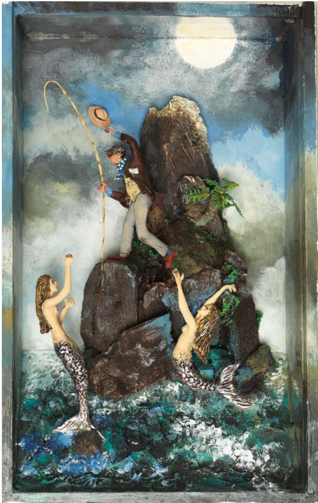
«La pêche aux belles», boîte - technique mixte, 35 x 22 x 8, 2016