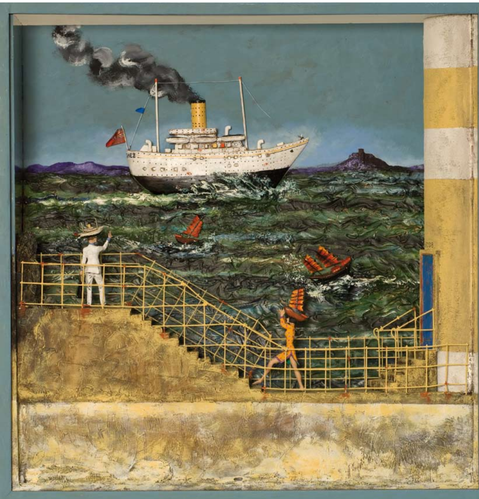
«Travailler du chapeau», boîte - technique mixte, 60 x 59 x 14, 2009