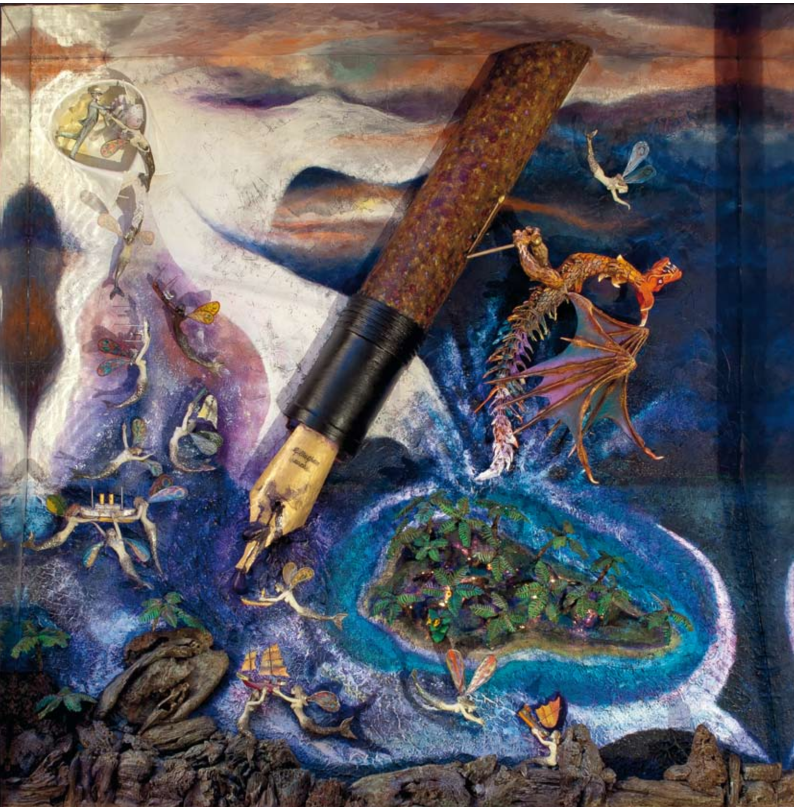
«Aux Ecrivains des mers violettes», boîte - technique mixte, 100 x 100 x 20, 2013