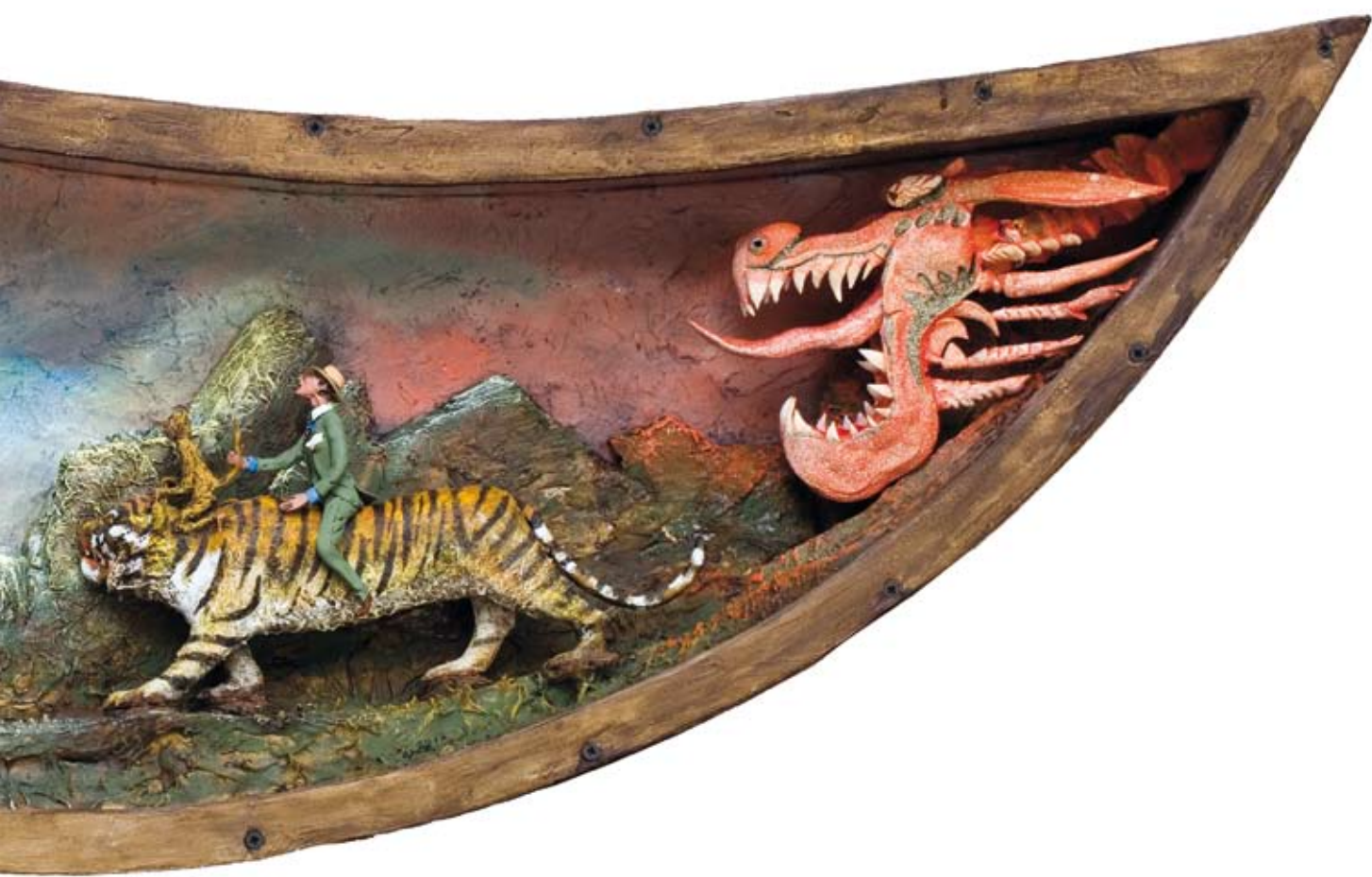
«A bord du Ouistitigre», boîte - technique mixte, 44 x 95 x 10, 2013