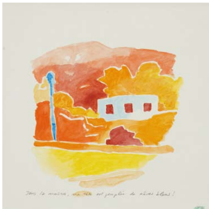
« Tête à l'envers », Acrylique sur papier, 30 x 30, 2016 « Rêves bleus », Acrylique sur papier, 30 x 30, 2016