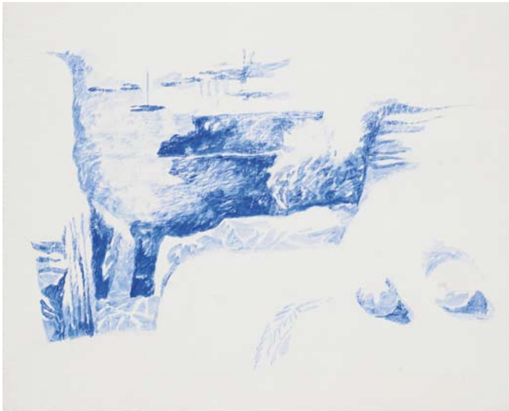
« Le bateau d'Ulysse », Acrylique sur toile, 30 x 60, 2016 « Terrasse bleue », Acrylique sur toile, 33 x 41, 2016