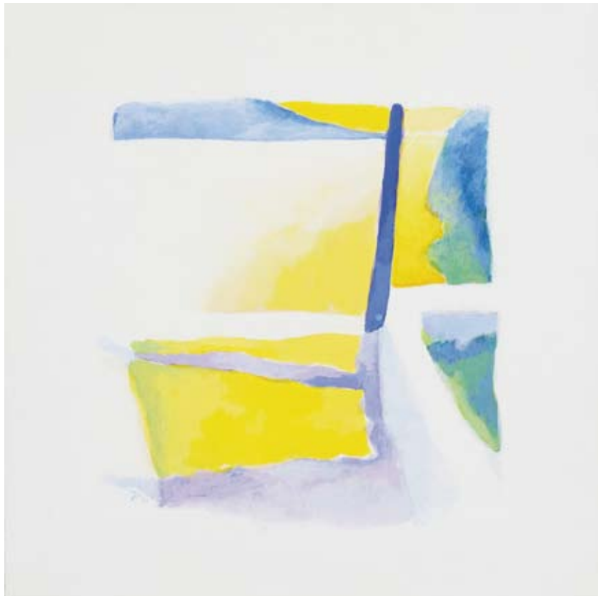
« Vers le blanc 1 », Acrylique sur toile, 40 x 40, 2016