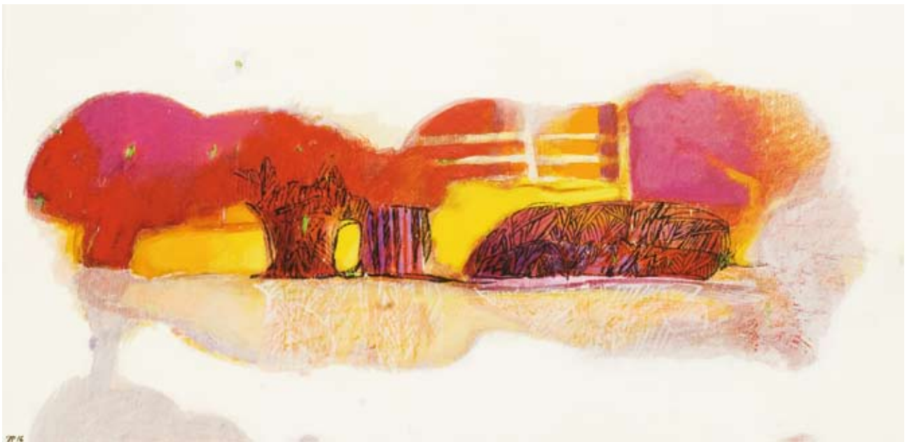
« Dans le rouge des tamaris », Acrylique sur toile, 34 x 70, 2016