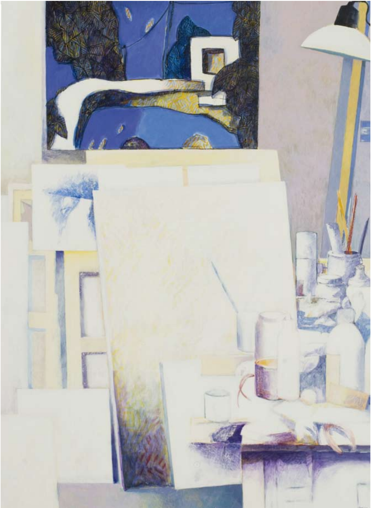
« Atelier blanc », Acrylique sur toile, 100 x 73, 2017