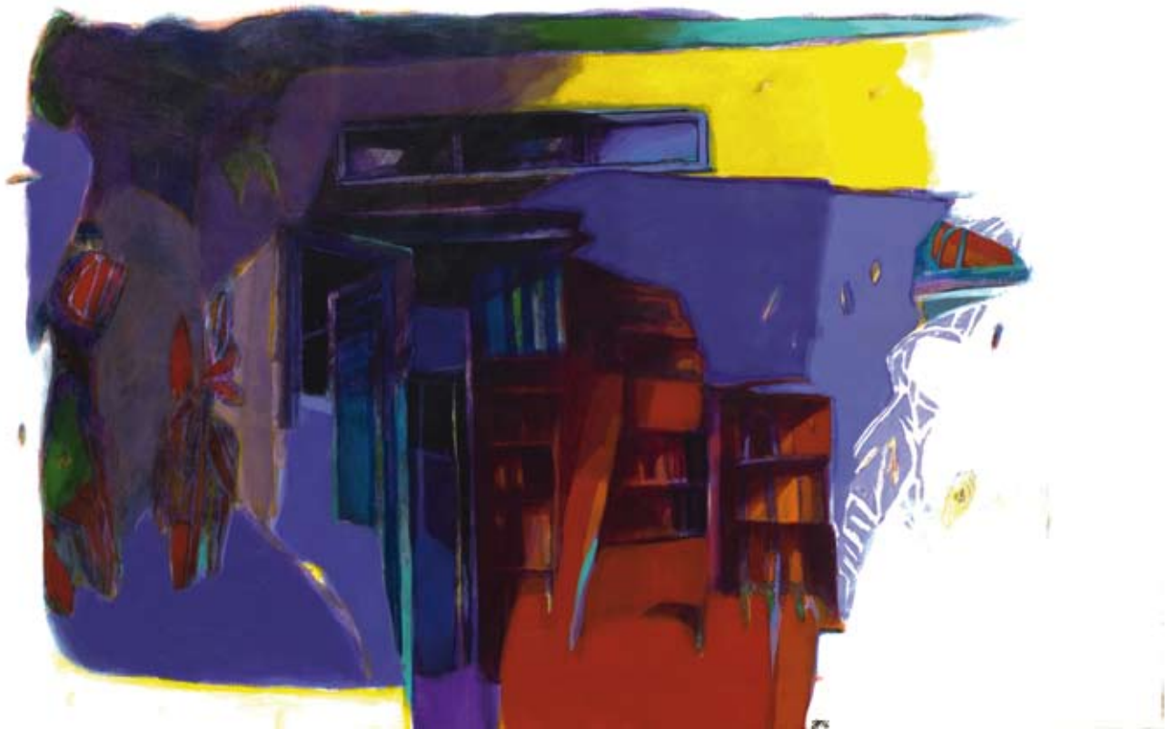
« Notre-dame de Folegandros », Acrylique sur toile, 65 x 100, 2016 « Dans la boutique d'Ulysse », Acrylique sur toile, 65 x 100, 2016