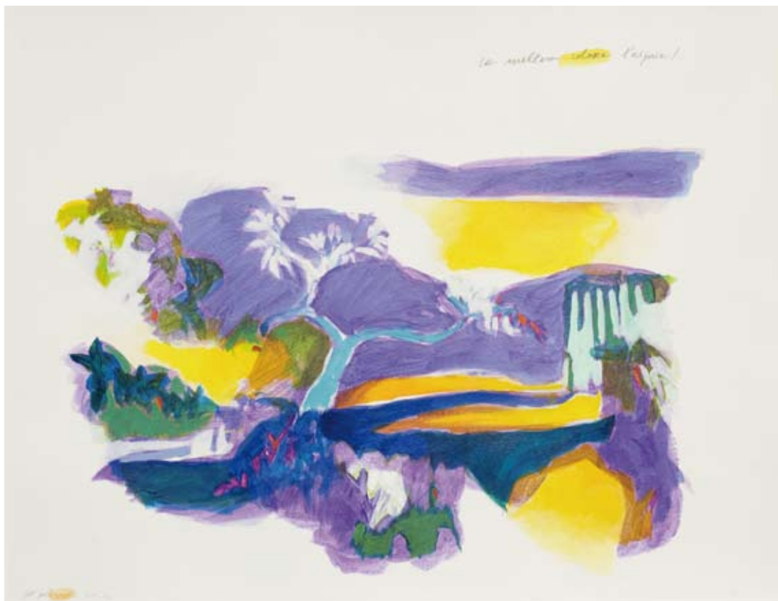
« Quelques oranges », Acrylique sur papier, 30 x 30, 2016 « Meltem coloré », Acrylique sur papier, 50 x 65, 2016