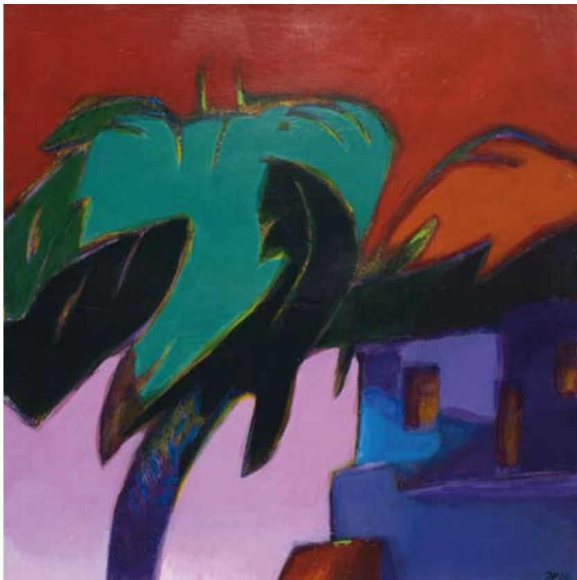
« Vent de feu 2 », Acrylique sur toile, 30 x 30, 2016 « Vent de feu 1 », Acrylique sur toile, 30 x 30, 2016