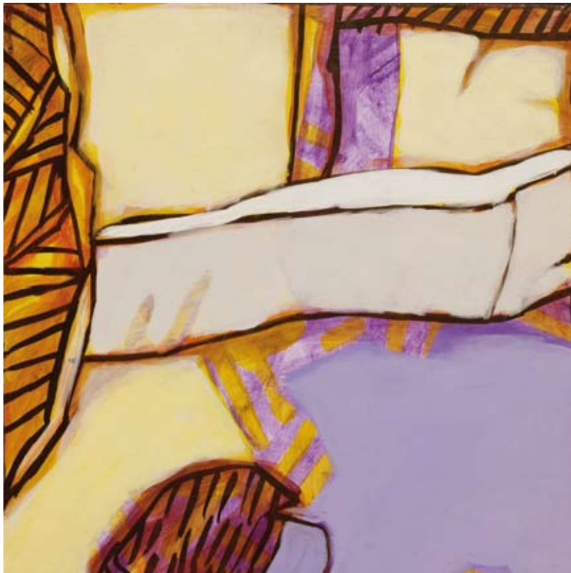
« Meltem vert », Acrylique sur toile, 30 x 30, 2016 « Mur de sable », Acrylique sur toile, 25 x 25, 2016