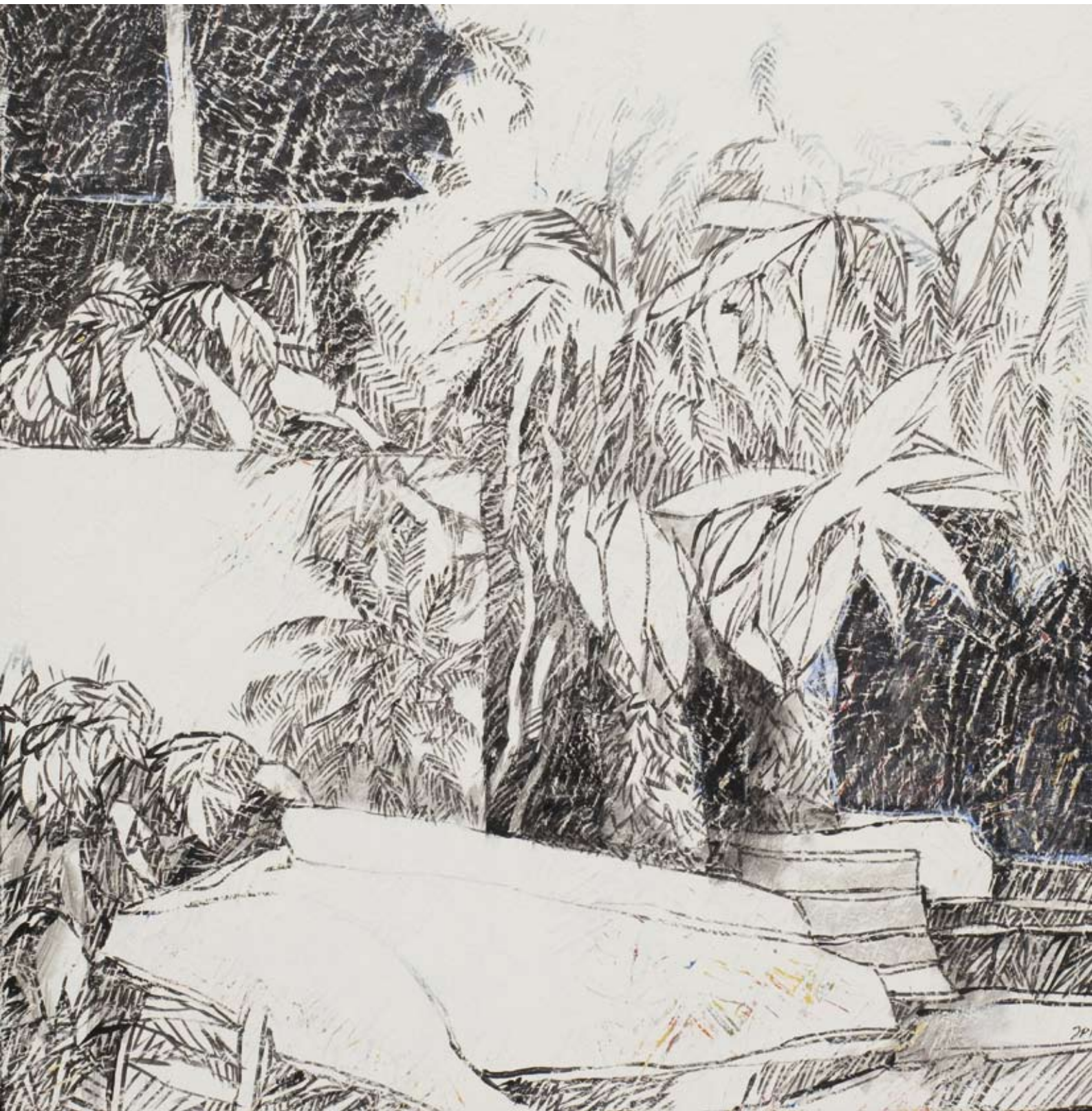
« Karavostasis 2 », Acrylique sur toile, 50 x 50, 2017