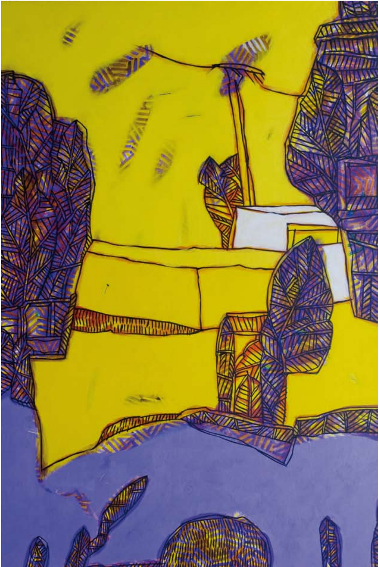
« Mur de soleil », Acrylique sur toile, 146 x 97, 2016