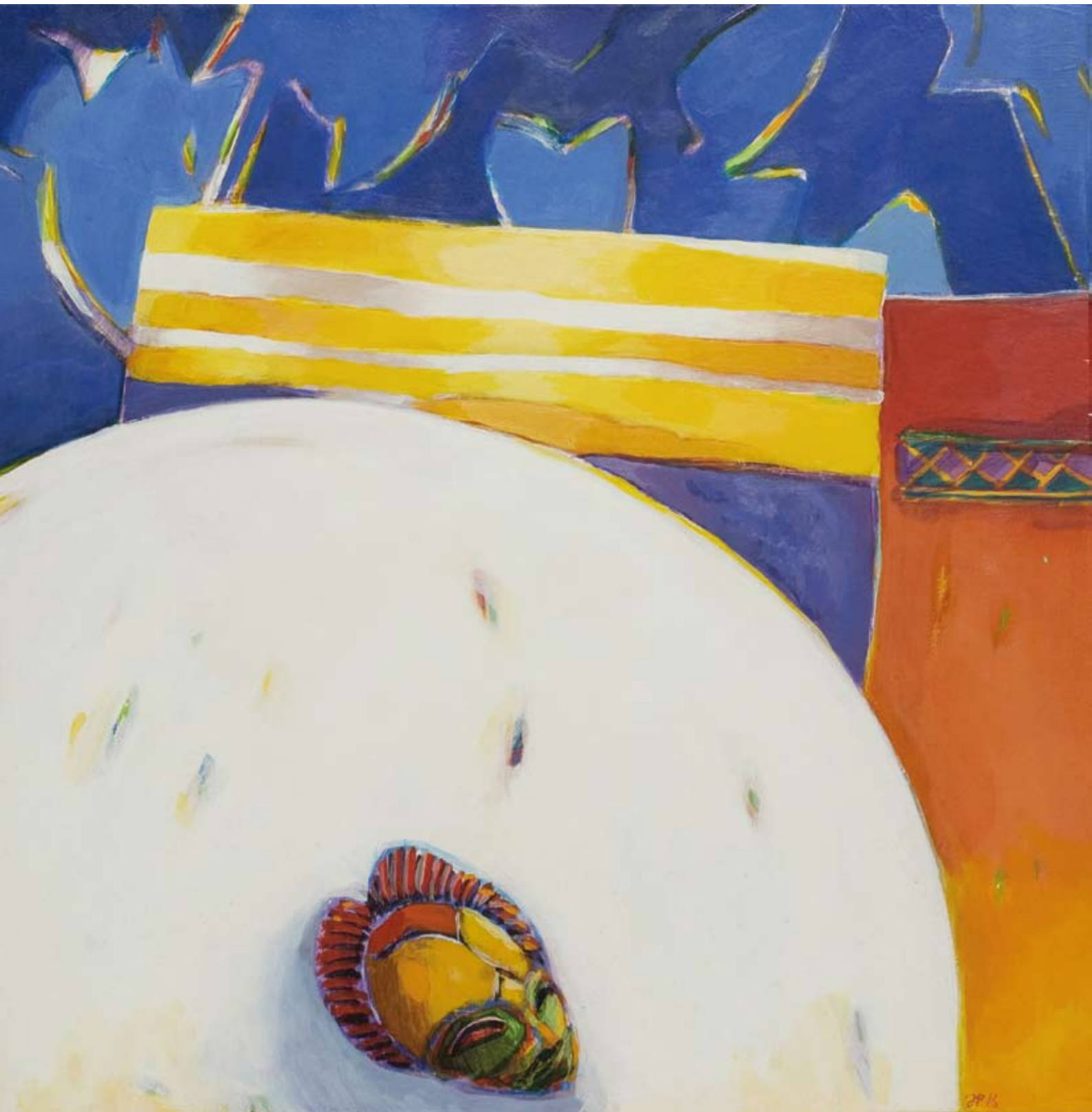
« Table masquée », acrylique sur toile, 50 x 50, 2016