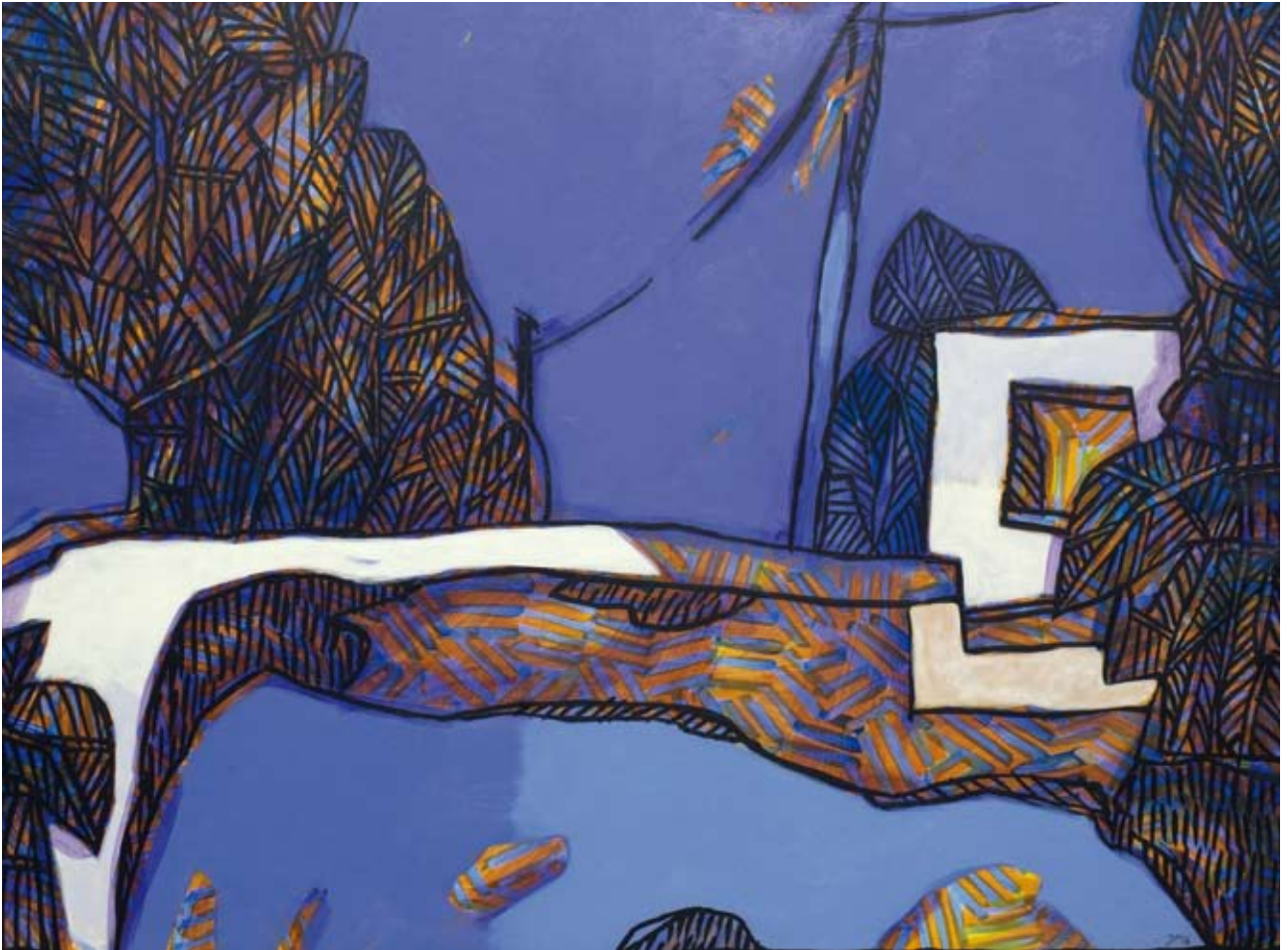
« Mur de neige », Acrylique sur toile, 54 x 73, 2016