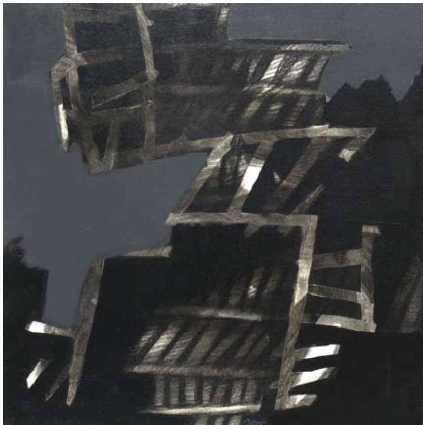
« Rivage d'ombre 1 », Tehnique mixte sur papier marouflé sur toile, 30 x 30, 2015 « Rivage d'ombre 2 », Tehnique mixte sur papier marouflé sur toile, 30 x 30, 2015