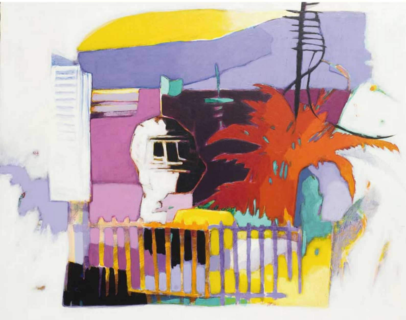
« Karavostasis 1 », Acrylique sur toile, 50 x 65, 2016