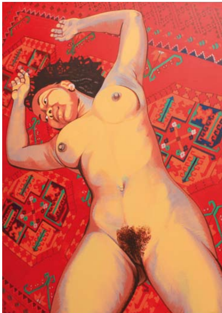
Caroline au tapis, 2002, acrylique sur toile, 97 x 162 cm Sénégal, 2000, acrylique sur toile, 162 x 114 cm