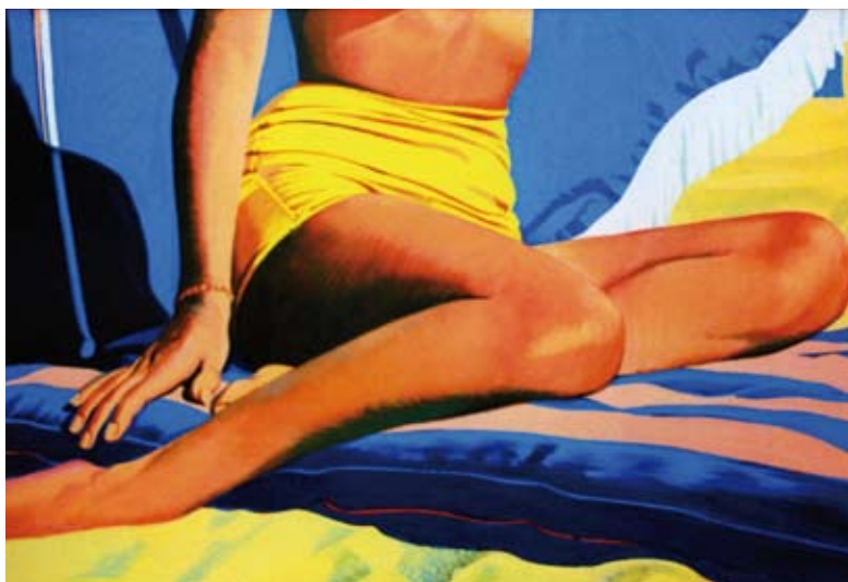
Souvenir de Santa Monica A, B, et C (Cinéma N° 20, 21 et 26), 1986 - acrylique sur toile, triptyque 3 fois 130 x 195 cm