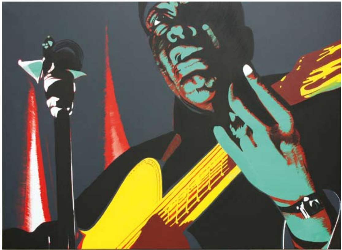
Leadbelly, 2011 - acrylique sur toile, 97 x 130 cm