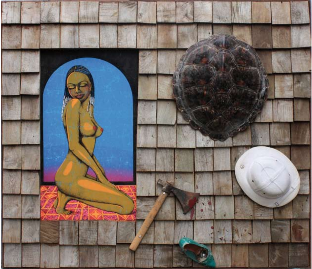
Fait divers (réalisé à la Réunion), 1992 - assemblage sur bois, 130 x 142 x 20 cm