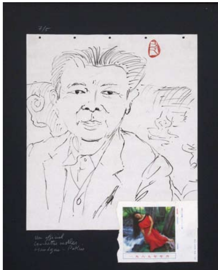
Carnet de voyage en Chine N° 2 - Cité Interdite, 1988, technique mixte sur papier, 68,5 x 58 cm Carnet de voyage en Chine N° 27 - L'Officiel, 1988, technique mixte sur papier, 68,5 x 58 cm