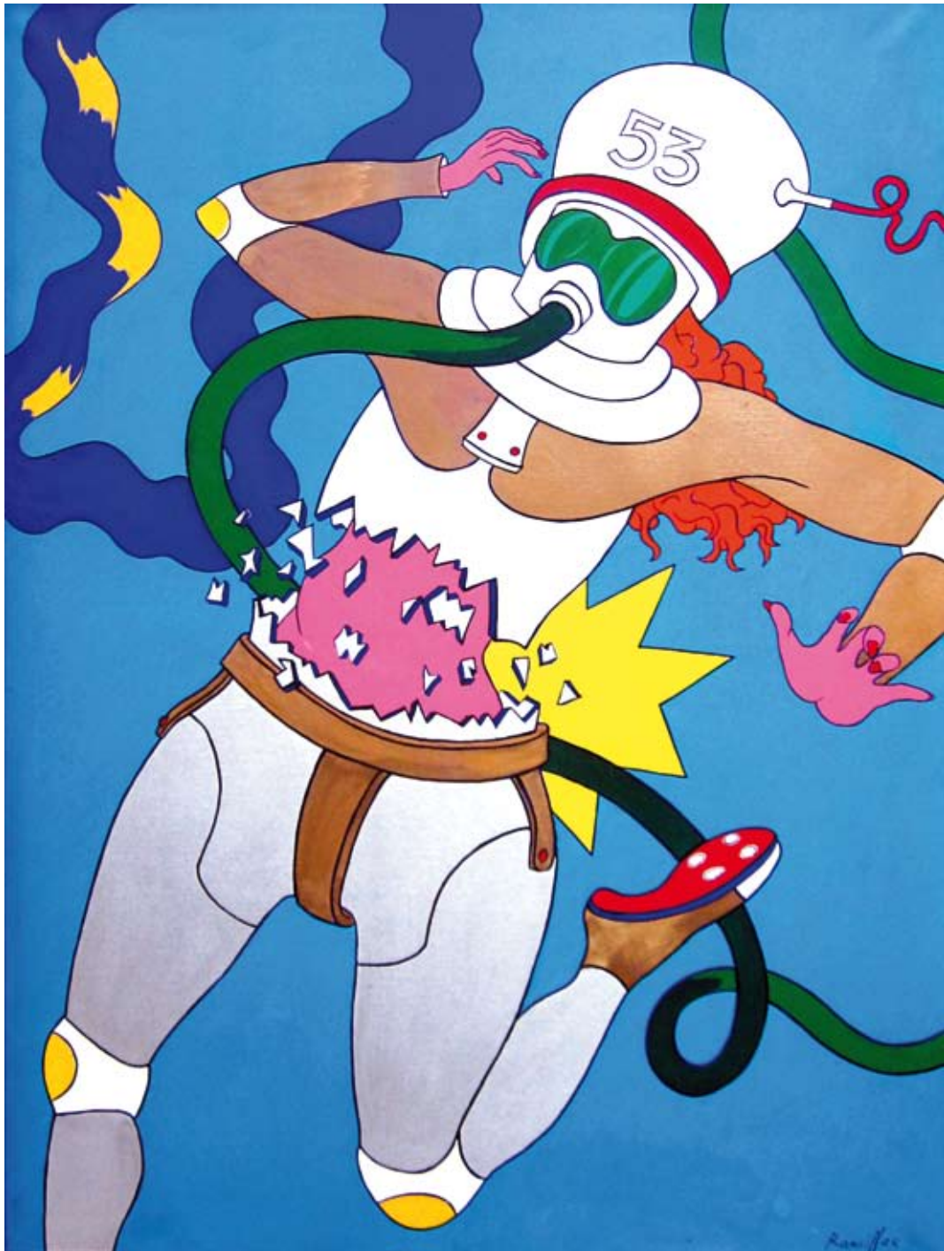
La Fiancée de l'espace, 1965 - huile sur toile, 130 x 97 cm