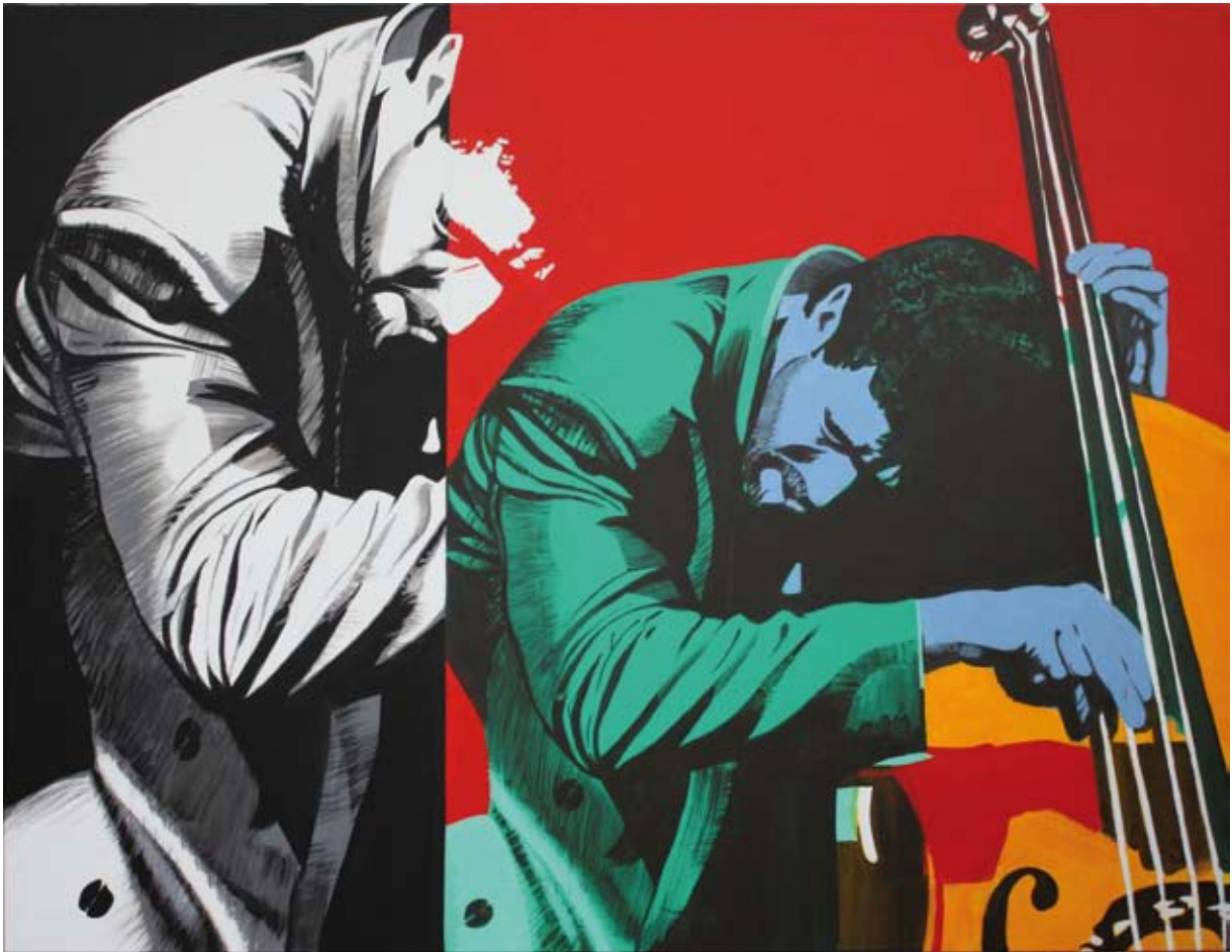
Mac McKee, 2010 - acrylique sur toile, 114 x 146 cm